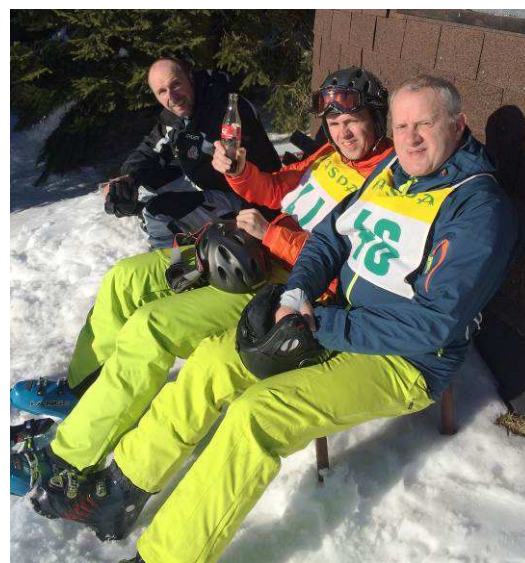
Alpine Vereinsmeisterschaften: Die Vorbereitungen vor dem Start sind unterschiedlich ... ☺